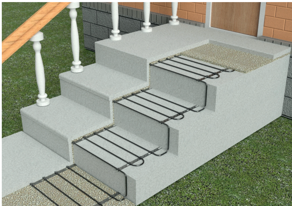
Рис. 3. Обогрев ступеней на крыльце

При монтаже кабелей на ступенях (входные группы) необходимо учитывать дополнительную площадь теплоотдачи. В этом случае рекомендуется перейти на шаг укладки кабеля 7,5 см (на ступени стандартной ширины 300 мм монтируется четыре нитки кабеля). Кроме того необходимо при монтаже сдвигать крайнюю нитку кабеля на самый край бетонной заготовки для лучшего прогрева края ступени, см. рис. 3.